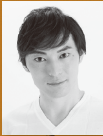
五代 了平 銘