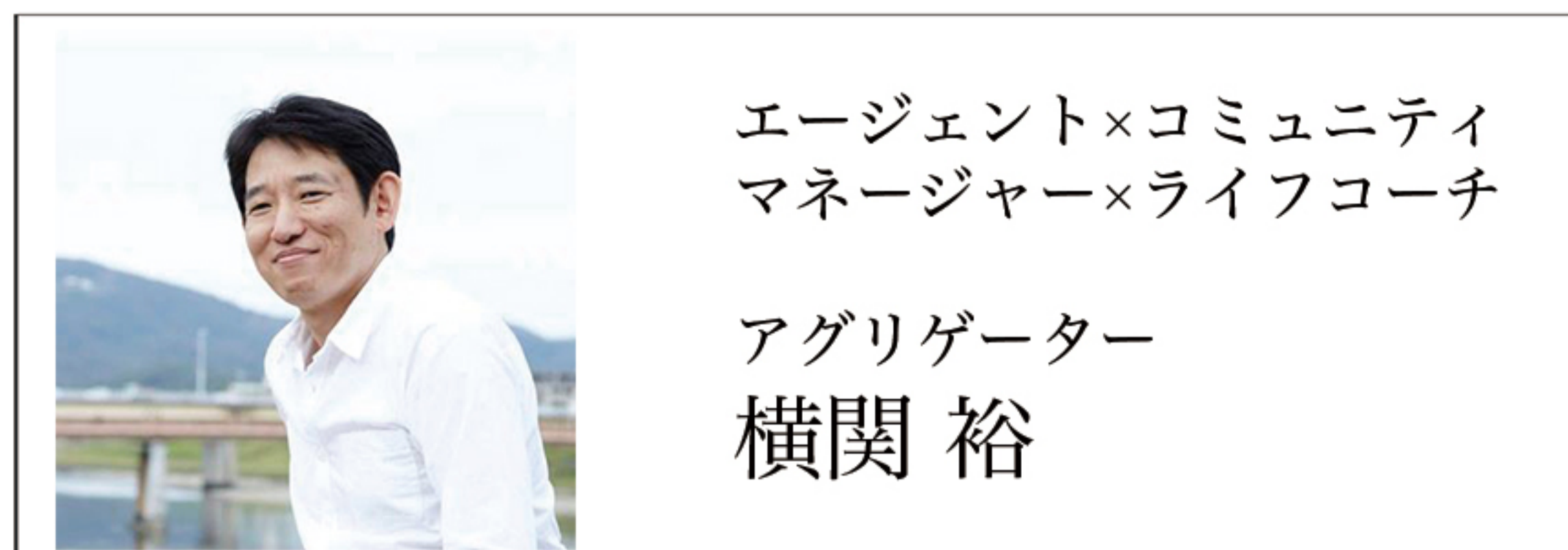
エージェンツ×コミュニティ マネージャー×ライフコーチ